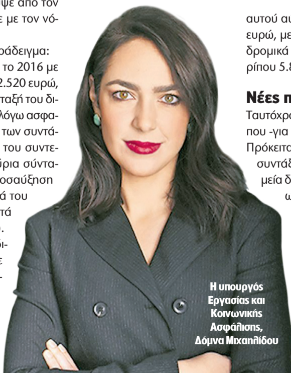
Η υπουργός Εργασίας και Κοινωνικής Ασφάλισης, Δόμνα Μιχαηλίδου

Σύμφωνα με τους εκπροσώπους των συνταξιούχων, τα αναδρομικά που έλαβαν ήταν σημαντικά «ψαλιδισμένα» λόγω της φορολόγησης 20%, και ζητούν από την κυβέρνηση ο πρόσθετος φόρος να επιβάλλεται σε σχέση με το κάθε έτος και όχι ως συνολικό ποσό, με βάση τη φορολογική κλίμακα που ισχύει για κάθε συνταξιούχο χωριστά, ανάλογα με το επίσημο εισόδημά του.