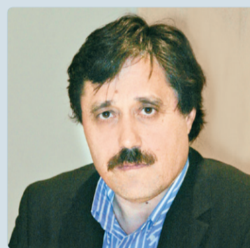
© Σάββας Καλεντερίδης Στρατηγικός αναλυτής και συγγραφέας

κοποίηση του νησιού, η περίπτωση Ερσίν Τατάρ ενδυναμώνουν τον αριθμό, το ηθικό των ψηφοφόρων του (εθνικιστικά μηνύματα), τα κατοχικά πολιτικά και κομματικά «ρεύματα» κ.ά. Τέλος, θα μπορούσε να προστεθεί ο χρησιμοποιούμενος εκ μέρους του λόγος για ενισχυμένη παρουσία και αξία της χώρας του στην ανατολική Μεσόγειο κ.λπ. Παρακολουθεί τις περιφερειακές εξελίξεις στην ευρύτερη περιοχή και επισημαίνει ότι η χώρα του έχει πολυδιάστατη δυναμική (μέσα σε αυτά εντάσσεται η βελτίωση των σχέσεων της Αγκυρας με το Κάιρο και την υπολογίσιμη παρουσία της Τουρκίας στη χασοτική εσωτερική λιβυκή πραγματικότητα).