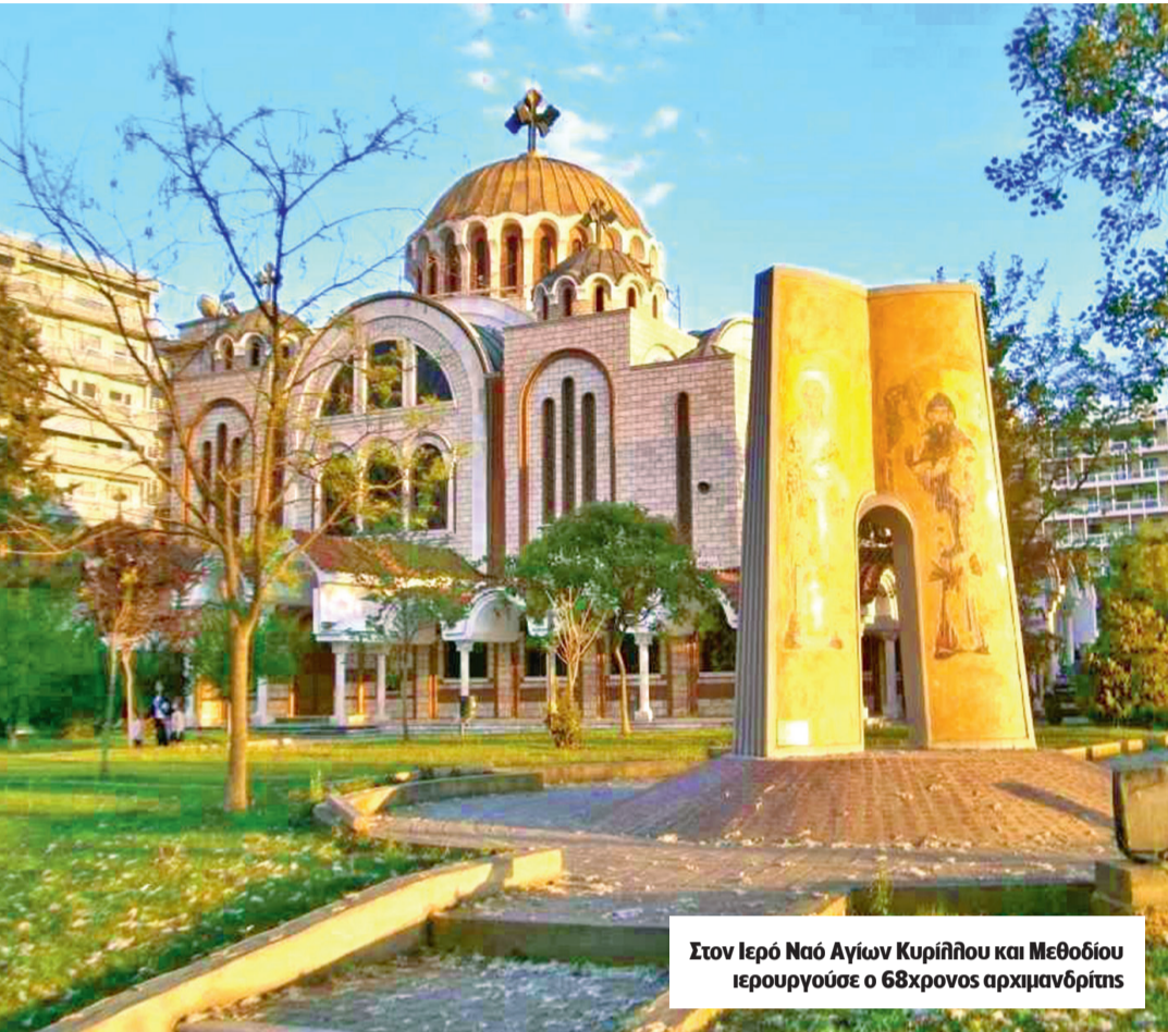
Στον Ιερό Ναό Αγίων Κυρίλλου και Μεθοδίου ιερουργούσε ο 68χρονος αρχιμανδρίτης