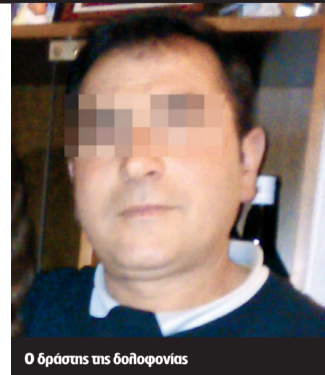
Ο δράστης της δολοφονίας