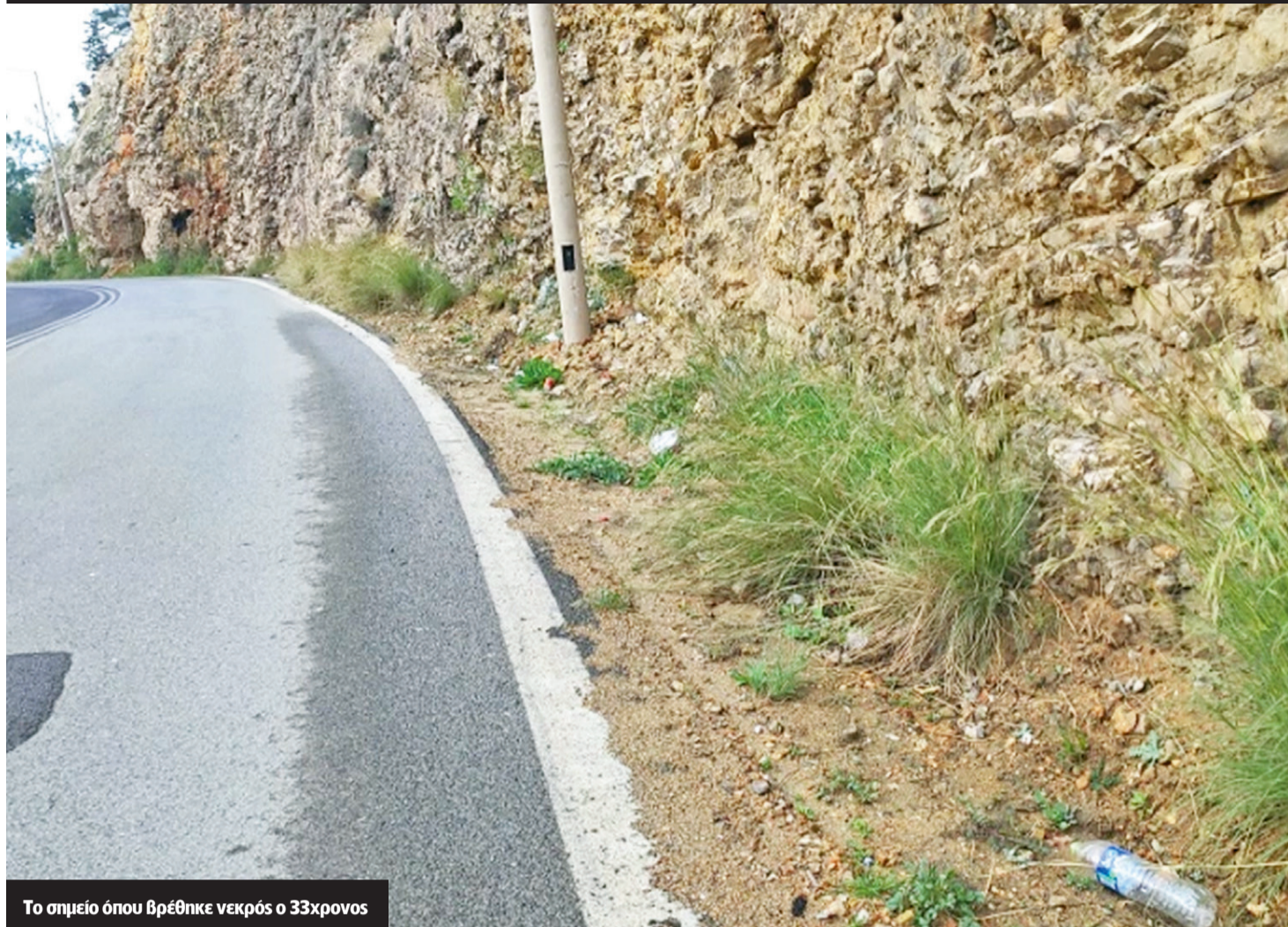
Το σημείο όπου βρέθηκε νεκρός ο 33χρονος