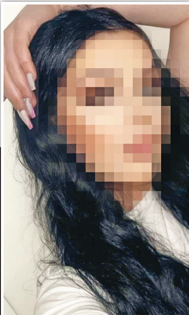
Η 31χρονη με το ψευδώνυμο «Λορέλα» φέρεται να «ψάρευε» τα ανήλικα κορίτσια