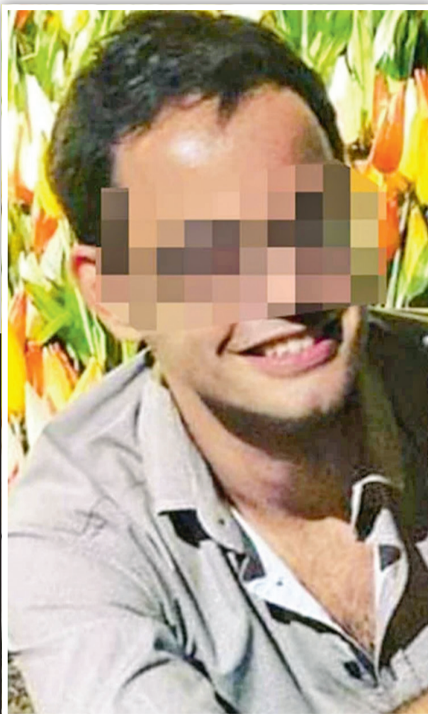
Ο 34χρονος από την Εκάλη, που δηλώνει φωτογράφος, πιθανολογείται ότι είχε ηγετικό ρόλο