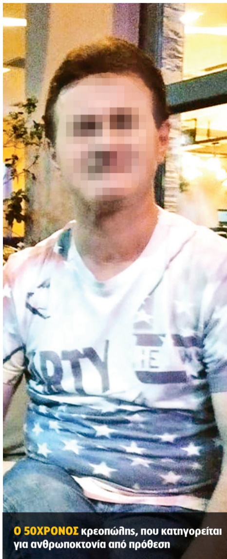
Ο 50ΧΡΟΝΟΣ κρεοπώλης, που κατηγορείται για ανθρωποκτονία από πρόθεση