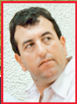
Ο «Θεός Τζο» δολοφονήθηκε μέσα στο σπίτι του στα Σκούρτα Βοιωτίας