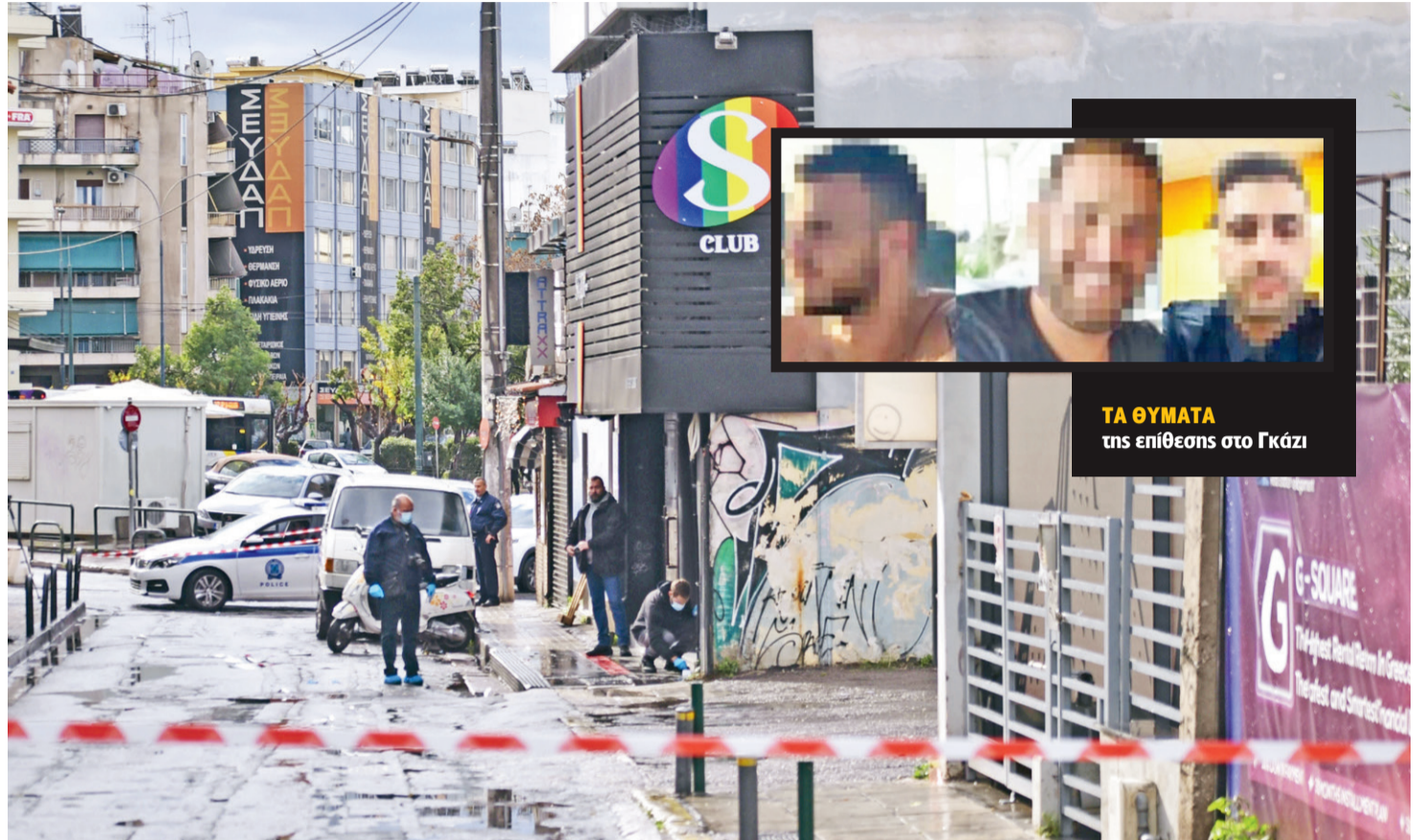
ΤΑ ΘΥΜΑΤΑ της επίθεσης στο Γκάζι

Την περασμένη Πέμπτη, ο 33χρονος φίλος του Αλβανού «πιστολέρο», που φαίνεται πως ξεκίνησε τον καβγά με τους νεαρούς από την Κρή-