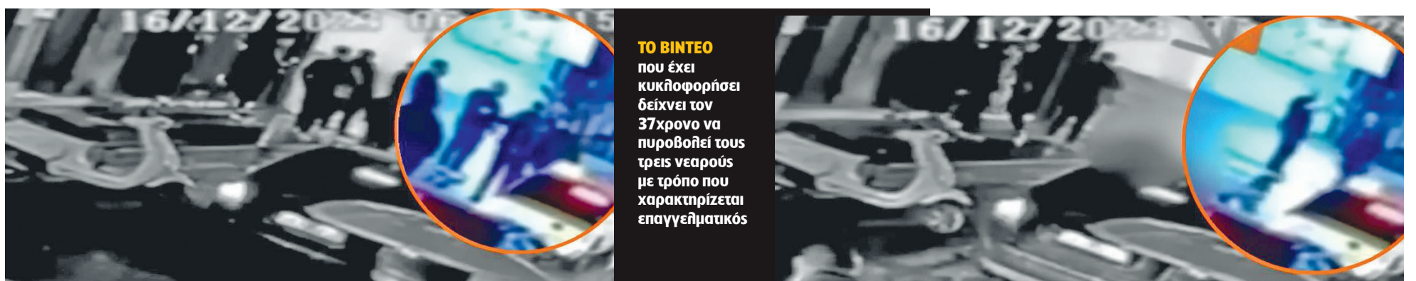
ΤΟ ΒΙΝΤΕΟ που έχει κυκλοφορήσει δείχνει τον 37χρονο να πυροβολεί τους τρεις νεαρούς με τρόπο που χαρακτηρίζεται επαγγελματικός

Με βάση αυτά τα δεδομένα, εκτιμούν πως υπάρχει πιθανότητα να μην έχει διαφύγει στη χώρα του και να κρύβεται σε κάποια περιοχή της Ελλάδας, ωστόσο από την πλευρά της ΕΛ.ΑΣ. έχει ήδη γίνει «ερυθρά αναγγελία» μέσω Ιντερπόλ και έχει ζητηθεί διεθνές ένταλμα σύλληψης.