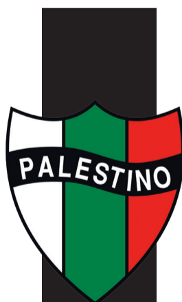
ΤΟ ΕΜΒΛΗΜΑ της ομάδας «Παλεστίνιο» στη Χιλή με τα χρώματα της σημαίας της Παλαιστίνης

Προπαρασκευαστικά, αποδείχθηκε ότι μέσα στον λαβύρινθο των υπόγειων στοών που έχει κατασκευάσει η Χαμάς στα έγκατα της Γάζας είχε αναπτυχθεί αυτόνομο ενσύρματο τηλεφωνικό δίκτυο, μέσω του οποίου γινόταν ο συντονισμός και δίνονταν οδηγίες.