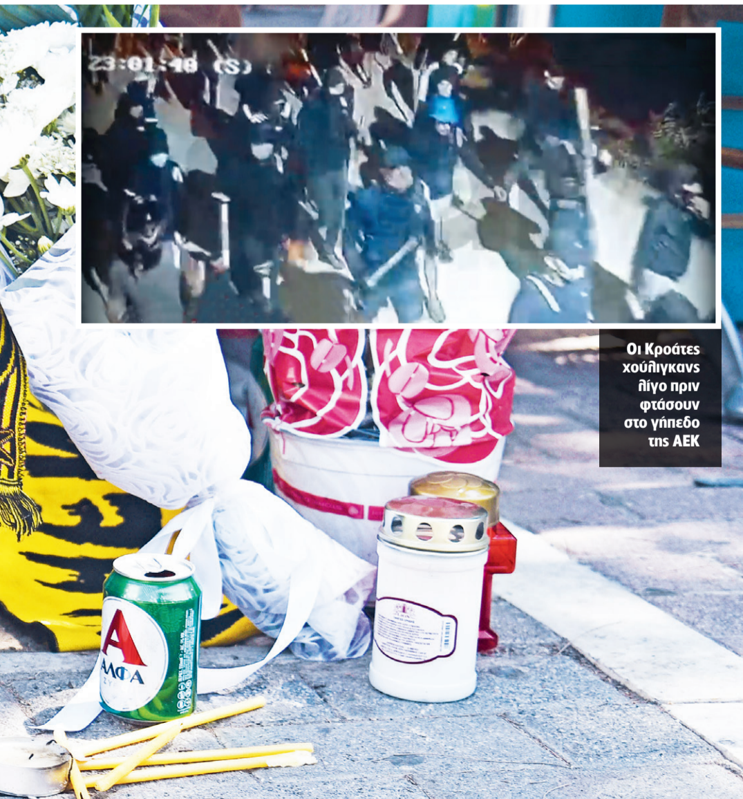
Οι Κροάτες χούλιγκανς λίγο πριν φτάσουν στο γήπεδο της ΑΕΚ