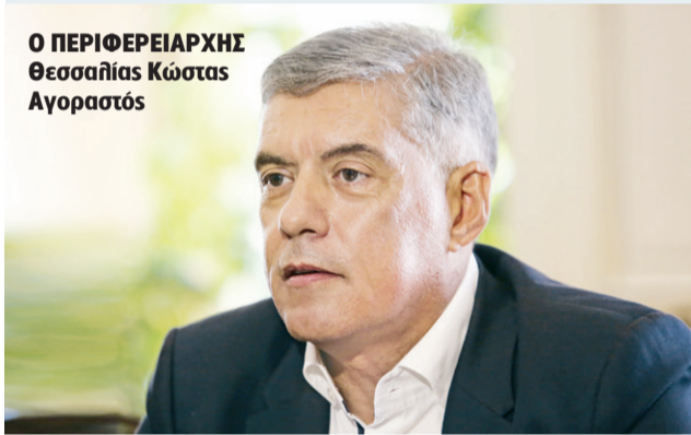
Ο ΠΕΡΙΦΕΡΕΙΑΡΧΗΣ Θεσσαλίας Κώστας Αγοραστός