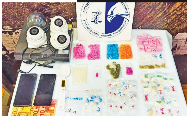
Μετά από έφοδο των αστυνομικών, στο σπίτι του αξιωματικού στον Άγιο Παντελεήμονα βρέθηκε σημαντική ποσότητα ναρκωτικών

Πιθανότητα από αυτό το πάρτι να ξεκινήσει και η αντίστροφη μέτρηση για τη σύλληψη του 39χρονου μόνιμου αξιωματικού της Πολεμικής Αεροπορίας. Την περασμένη Τρίτη, 11 Ιουλίου, μετά από έφοδο των αστυνομικών, στο σπίτι του αξιωματικού στον Άγιο Παντελεήμονα βρέθηκε σημαντική ποσότητα ναρκωτικών. Σύμφωνα με αξιωματικούς της Δίωξης Ναρκωτικών, ο 39χρονος διακινούσε τις παράνομες ουσίες σε πάρτι που διοργανώνονταν στη Μύκονο και στην Αττική. Συγκεκριμένα, στην οικία του εντοπίστηκαν και κατασχέθηκαν 6 αυτοσχέδιες νάιλον συσκευασίες με 5,5 γραμμάρια κοκαΐνη, 24 συσκευασίες με 51,1 γραμμάρια κρυσταλλική μεθαμφεταμίνη, 32 συσκευασίες με 29,4 γραμμάρια MDMA, 29 συσκευασίες με 37,9 γραμμάρια μεφεδρόνη, 2 συσκευασίες με κεταμίνη, 5 συσκευασίες με ακατέργαστη κάνναβη υδροπονικής καλλιέργειας και 332 δισκία ecstasy. Ακόμη βρέθηκε μία ηλεκτρονική ζυγαριά ακριβείας, ενώ κατασχέθηκαν δύο κινητά τηλέφωνα, τα οποία εξετάζονται στα εγκληματολογικά εργαστήρια. Μάλιστα, όπως φαίνεται, ο 39χρονος είχε φροντίσει να λάβει και τα μέτρα του, καθώς είχε τοποθετήσει στο σπίτι του συνολικά τέσσερις κάμερες, ώστε να είναι προετοιμασμένος για ενδεχόμενη έφοδο των αστυ-