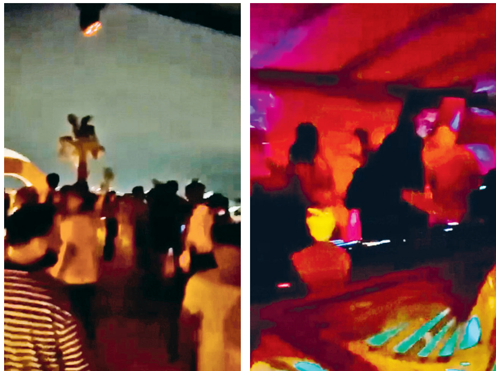
Αποκλειστικές εικόνες από το πάρτι σε βίλα στη Μύκονο όπου αστυνομικοί πραγματοποίησαν έλεγχο και εντόπισαν μεγάλες ποσότητες ναρκωτικών

Στις αρχές Ιουλίου, σε μια πολυτελή βίλα στη Μύκονο, περίπου 200 άτομα χόρευαν στους ρυθμούς της ηλεκτρονικής μουσικής. Μεταξύ των πελατών που πλήρωσαν εισόδο για να πάρουν μέρος στο πάρτι ήταν και αστυνομικοί της Ασφάλειας που βρίσκονταν σε μυστική αποστολή. Με προσοχή παρατηρούσαν τις κινήσεις των θαμώνων και, όταν έκριναν πως είχε έρθει η κατάλληλη στιγμή, έθεσαν σε εφαρμογή το σχέδιό τους. Λίγο πριν από τα μεσάνυχτα, απαίτησαν από τον DJ του πάρτι να σταματήσει τη μουσική και άμεσα άρχισαν τον σωματικό έλεγχο των παρευρισκομένων. Τα ευρήματά τους επιβεβαίωσαν τις υποψίες τους, καθώς διαπίστωσαν ότι κάποιοι είχαν εκμεταλλευτεί το πάρτι στη βίλα της Μυκόνου για να στήσουν ένα μικρό «σούπερ μάρκετ» ναρκωτικών. Συνολικά, εντόπισαν 60 γραμμάρια κοκαΐνης, 20 γραμμάρια χασίς, κά-