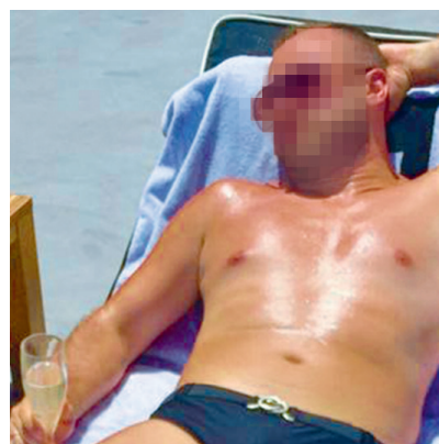
Ο κατηγορούμενος εργαζόταν στο 251 Γενικό Νοσοκομείο Αεροπορίας