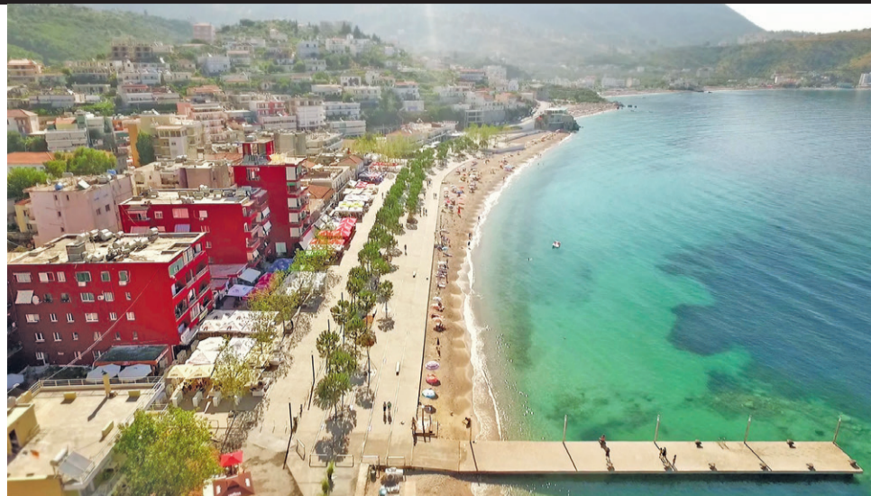
Η ΦΩΤΟΡΕΑΛΙΣΤΙΚΗ απεικόνιση της ανάπτυξης της παραλίας της Χειμάρρας (πάνω). Τα σχέδια του 2016 για την ανάπτυξη (κάτω) έχουν υλοποιηθεί μόνο μερικώς

Παράγοντες της ομογένειας και αλβανικά ΜΜΕ έχουν καταγγείλει εδώ και έναν χρόνο ότι ο Αρτάν Γκάτσι , σύζυγος της υπουργού Εξωτερικών της Αλβανίας, Ολτα Τζάτσκα , έχει ανακηρυχθεί διά νόμου στρατηγικός επενδυτής, βάζοντας στο στόχαστρο οικόπεδα-φιλέ-