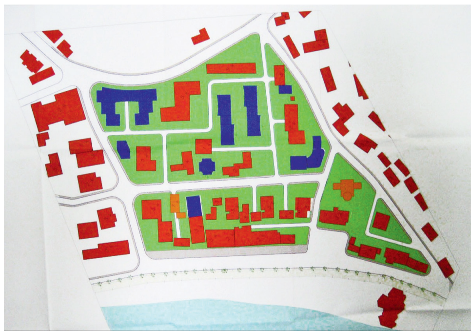
Με κόκκινο και πορτοκαλί χρώμα, το σχέδιο που αποκαλύπτει η «R» δείχνει ποια κτίρια της Χειμάρρας πρέπει να γκρεμιστούν για τη δημιουργία τουριστικών κατοικιών. Τα περισσότερα από αυτά τα κτίρια ανήκουν σε Έλληνες