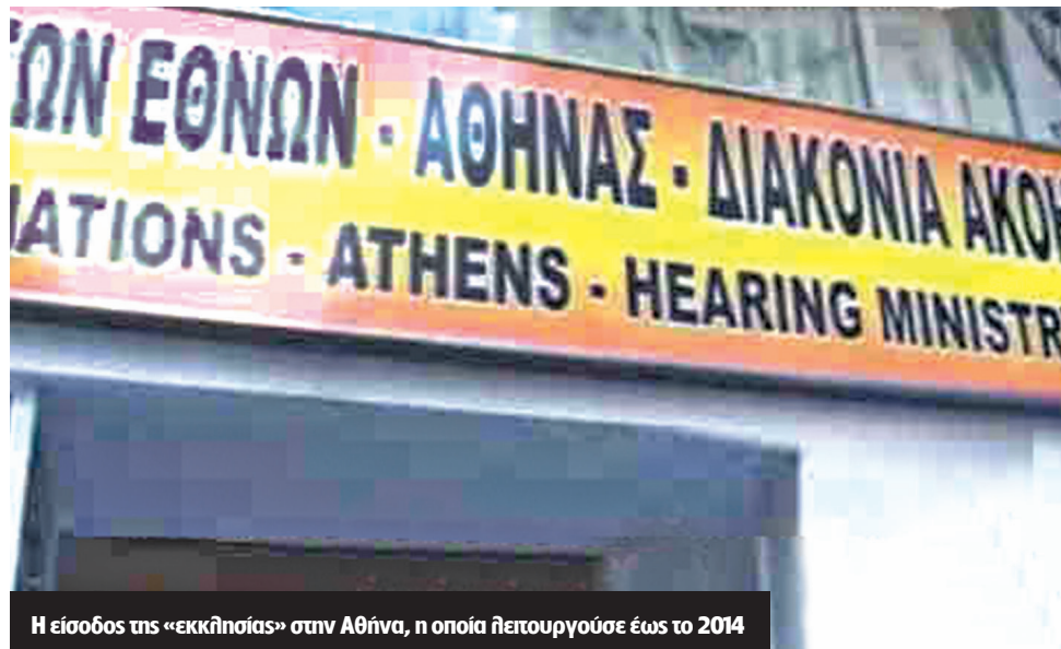
Η είσοδος της «εκκλησίας» στην Αθήνα, η οποία λειτουργούσε έως το 2014

σαλονίκη, οι καταγγελίες πέφτουν «βροχή» και αφορούν την οικονομική εκμετάλλευση, αλλά και την ψυχολογική κατάρρευση ανθρώπων που εμπιστεύτηκαν την αίρεση.