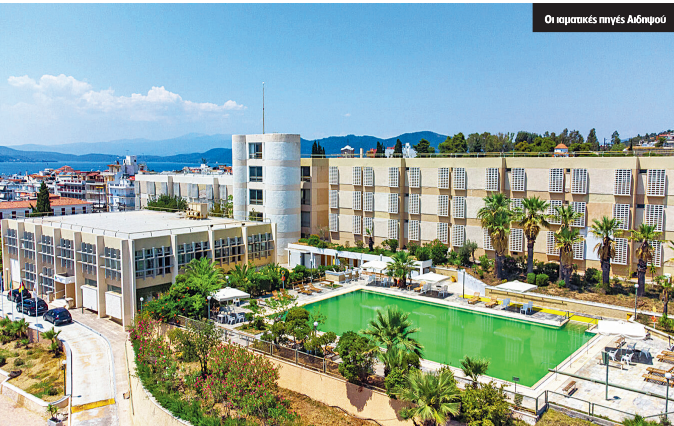
Οι ιαματικές πηγές Αιδηψού

Με βάση το αναθεωρημένο Επιχειρησιακό Πρόγραμμα Αξιοποίησης, το Ταμείο έχει δρομολογήσει την εκμετάλλευση πέντε ιαματικών πηγών. Πρόκειται για assets που μπορεί να μη συγκαταλέγονται στα «βαριά» χαρτιά του ΤΑΙΠΕΔ, καθώς είναι μικρότερης αξίας, ωστόσο διαθέτουν σημαντικό αποτύπωμα για τις τοπικές κοινωνίες.