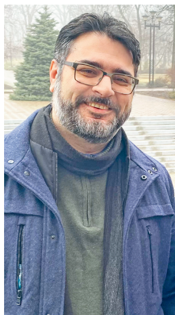
Ο Έλληνας πρόξενος στη Μαριούπολη και μοναδικός Ευρωπαίος διπλωμάτης που έχει παραμείνει στην Ουκρανία, Μανώλης Ανδρουλάκης

να πάνε στραβά», τονίζει ο Έλληνας πρέσβης στην Ουκρανία, εξηγώντας πως οι κίνδυνοι ήταν πολλοί και θα μπορούσαν να προκύψουν από οπουδήποτε. «Ακόμη και το πιο απλό να συνέβαινε, όπως να χρειαζόταν κάποιος ιατρική φροντίδα και να έπρεπε να περιμένουμε να έρθει κάποιο ασθενοφόρο, αυτό θα σήμαινε ότι θα έπρεπε να καθηλωθεί ολόκληρη η αυτοκινητοπομπή. Δεν θα μπορούσαμε να φύγουμε. Το είχαμε πει από την αρχή: κανείς δεν θα μείνει πίσω», αναφέρει ο Φρ. Κωστελλένος.