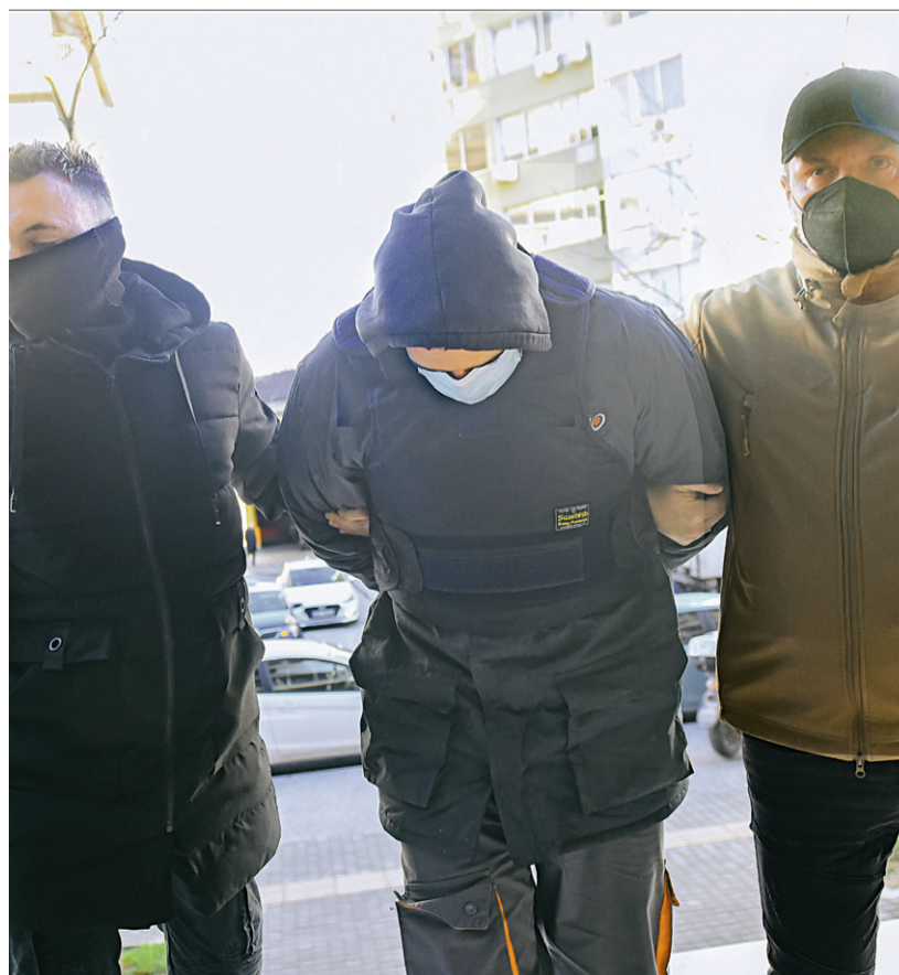
Η στάση «δεν ξέρω τίποτα» του 23χρονου С.Α. , που πρώτος συνελήφθη, γρήγορα άλλαξε και ενώπιον της ανακρίτριας έδωσε «διευθύνσεις και ονόματα»

Όπως περιγράφει, εκείνη την ημέρα πήγε μαζί με έναν φίλο του στο γήπεδο για να παρακολουθήσει τον αγώνα βόλεϊ μεταξύ ΠΑΟΚ και Ολυμπιακού. Στη συνέχεια πήγαν στον σύνδεσμο του ΠΑΟΚ επί της οδού Παλαιών Πατρών Γερμανού. «Θύματα του φανατισμού, ξεκινήσαμε από το κέντρο της Θεσσαλονίκης τρία αυτοκίνητα προς αναζήτηση των οπαδών του Αρν, που, όπως γνω-