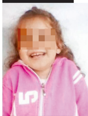
Τα τρία αγγελούδια της οικογένειας