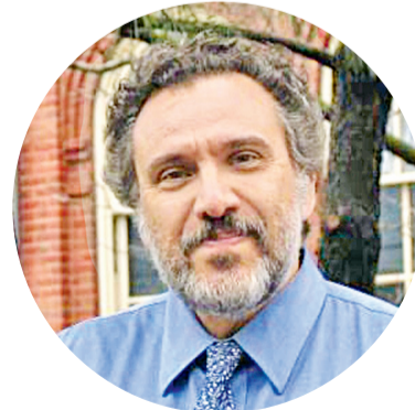
© Οθων Ηλιόπουλος Αναπληρωτής καθηγητής Ιατρικής και κλινικός ογκολόγος στο Harvard Medical School και στο Massachusetts General Hospital Cancer Center

➤ Να ξεκινήσουμε εκστρατεία ενημέρωσης πόρτα-πόρτα για τα εμβόλια και τους κανόνες υγείας, να βάλουμε την εκπαίδευση των παιδιών σε συνθήκες που προάγουν τη σωματική και ψυχική υγεία σαν άμεση προτεραιότητα.