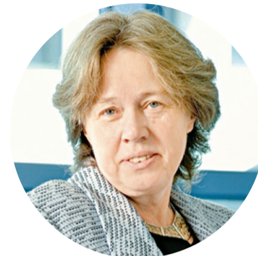
© Αθηνά Λινού Καθηγήτρια Επιδημιολογίας, πρόεδρος Ινστιτούτου Prolepsis

Συμπέρασμα 2: Οι πλούσιες χώρες έχουν υποχρέωση να σπρώξουν το βάρος του εμβολιασμού των φτωχών χωρών, έτσι ώστε να μειωθεί η πιθανότητα μεταλλαγών που περιμένουμε να γίνουν σε φτωχές, χωρίς εμβολιαστική κάλυψη χώρες και να διασπαρούν