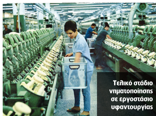
Τεχνικό στάδιο νηματοποίησης σε εργοστάσιο υφαντουργίας

ΤΟ ΒΙΒΛΙΟ «Καινοτομία και βιομηχανικός μετασχηματισμός στην Ελλάδα 1950-1973. Διαδεδομένοι μύθοι και αφανείς αλήθειες», που μόλις κυκλοφόρησε, στηρίζεται σε πολυετή έρευνα και ενδελεχή τεκμηρίωση του συγγραφέα Λευτέρη Αναστασάκη , από τον εκδοτικό οίκο « Economia Publishing ». Καταπιάνεται με την ιστορία της Ελληνικής Βιομηχανίας από το 1950 έως το 1973, την καινοτομική