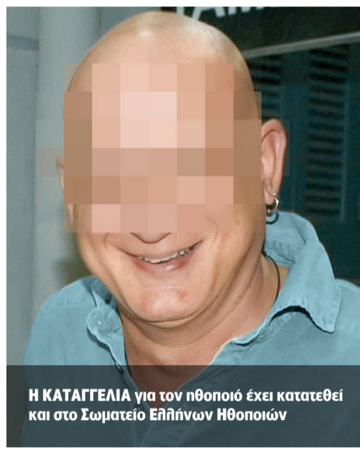
Η ΚΑΤΑΓΓΕΛΙΑ για τον ηθοποιό έχει κατατεθεί και στο Σωματείο Ελλήνων Ηθοποιών

Συνταράσσεται ξανά ο ελληνικός καλλιτεχνικός χώρος μετά τη δίωξη εναντίον γνωστού ηθοποιού για βιασμό τον Ιούλιο του 2020